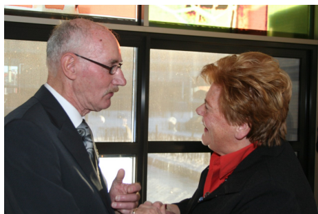
benoeming tot erelid