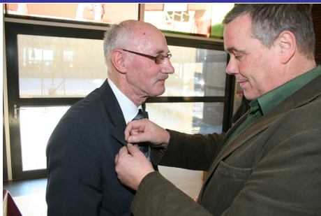
speld van verdienste NHV

NHV leden kunnen kopij insturen naar afdelingsburo@nhvbrabant.nl De redactie bepaalt wat wel of niet geplaatst wordt.